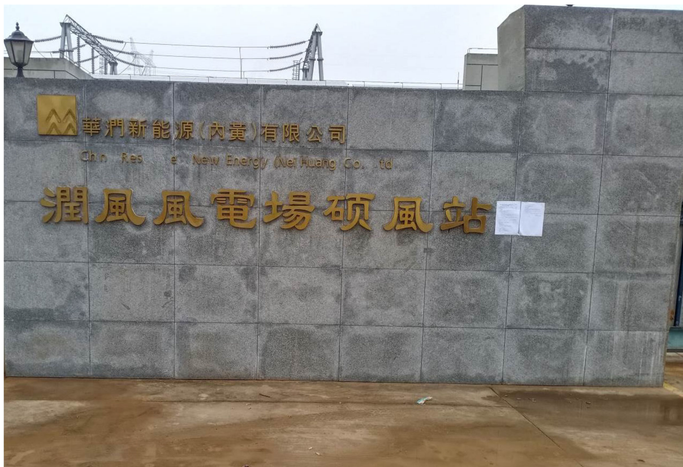
220kV 碩風升压站张贴公示