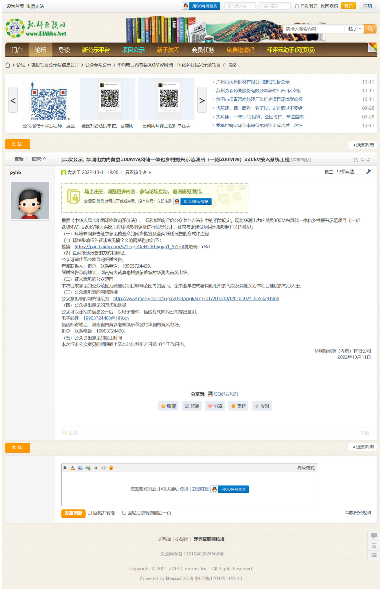
附图二：征求意见稿网络平台公示