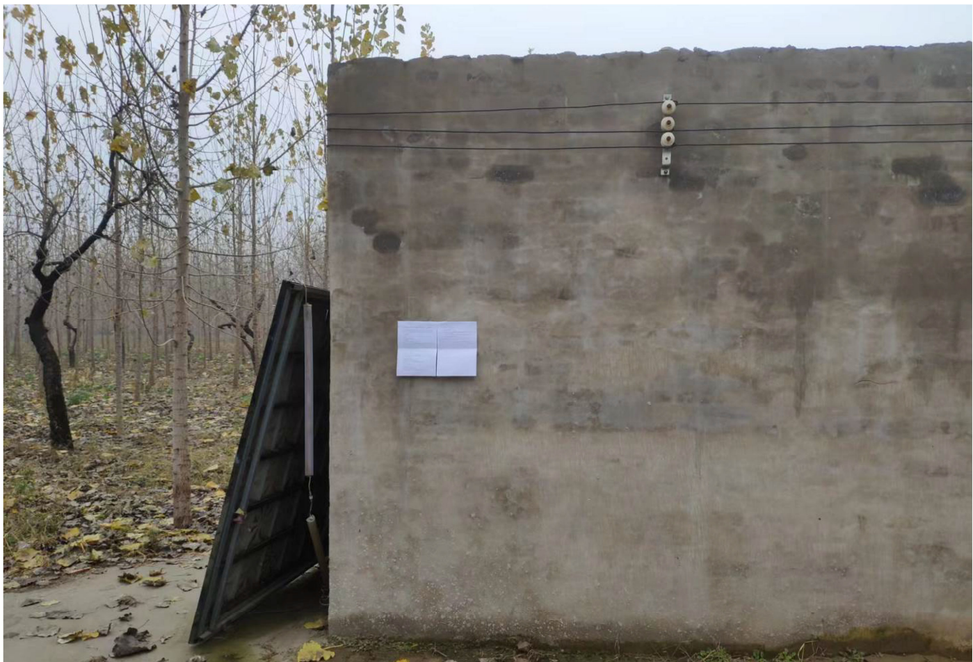
东草坡村张贴公示