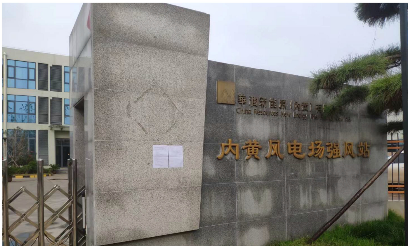
220kV 强风升压站张贴公示