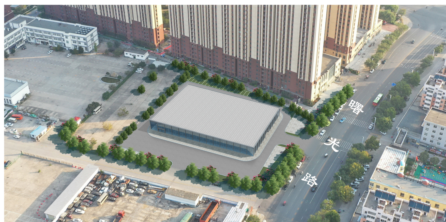
曙光农贸市场(暂定名)项目建筑方案(临时建筑)