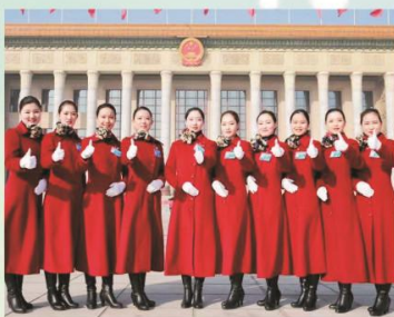
我校学生在北京为“两会”服务