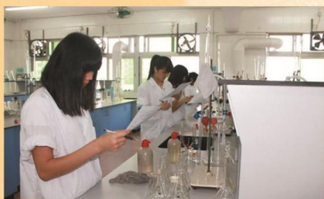
作物生产技术专业