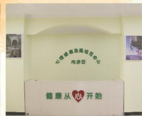
▲ 心理健康发展指导中心