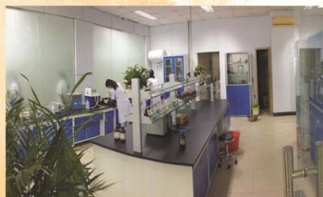
制药技术应用专业