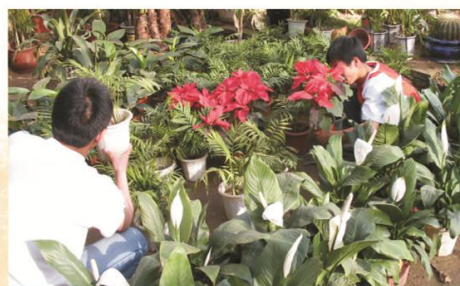
作物生产技术专业