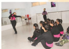
理论与实践相结合 一体化教学