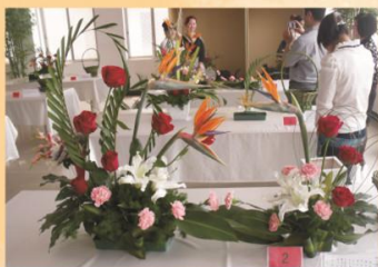
我校学生参加河南省插花技能大赛

“普高有高考，中职有大赛”。我校高度重视学生实践课教学和动手能力的培养，大力推行课堂教学改革，提倡理实一体化教学模式。把技能竞赛与日常教学紧密融合，周周进行技术练兵，以赛促教，教赛融合，学校层面的技能竞赛覆盖学生比例达100%。我校多次荣获安阳市技能大赛团体第一名，代表安阳市参加省级、国家级大赛。近年来，我校在国家级大赛中9个项目获奖、省级大赛中130个项目获奖、市级大赛中357个项目获奖，居全市中职学校之首。多次承办市技能大赛、素质能力大赛、中华优秀传统文化大赛、“文明风采”大赛，并多次荣获“优秀组织奖”。