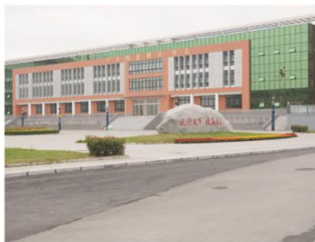
学生创业孵化中心