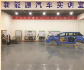
▲ 新能源汽车实训室