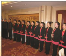
▲ 北京河南大厦学生实习