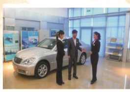
汽车专业实训课教学