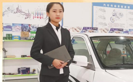
汽车运用与维修专业