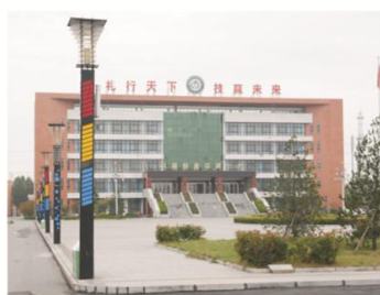
创新创业实训中心