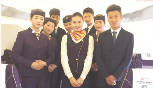
旅游服务与管理专业

我校紧扣县域主导产业、新兴产业和中原经济区建设对人才的需求，盘活学校现有场馆和教学设施资源，满足学生阳光、体面、高薪就业的需求，努力建设八大品牌专业：制药技术应用、电子商务、计算机应用、音乐表演、旅游服务与管理、运动训练、汽车运用与维修、会计事务。