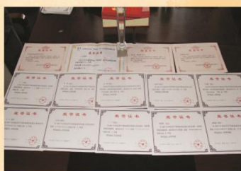
我校在“三项大赛”中荣获的国家级、省级荣誉证书和奖杯