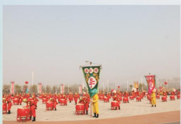
“精忠战鼓”表演在汤阴县“精忠报国·厚德传家”纪念岳飞诞辰915周年暨文艺展演活动中震撼上演