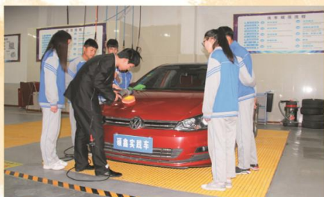
汽车运用与维修专业