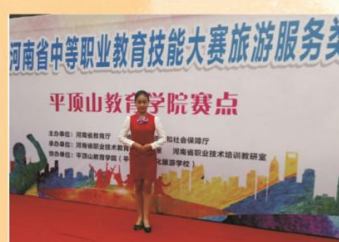
我校学生参加河南省中等职业教育技能大赛旅游服务类比赛