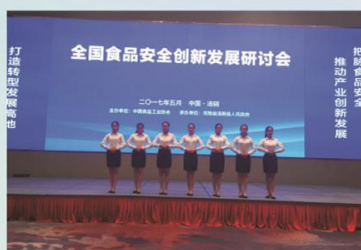
学生礼仪服务全国食品安全创新发展研讨会