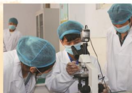
作物生产技术专业实训教学