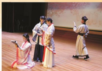
我校学生参加河南省中等职业学校中华优秀传统文化大赛经典短剧比赛