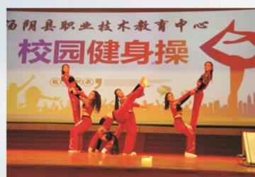
魅力职教·校园健身操