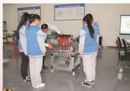
汽车专业实训课教学