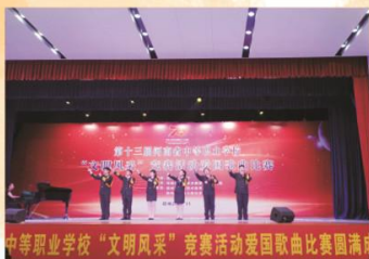
我校学生参加河南省中等职业学校“文明风采”竞赛活动爱国歌曲比赛