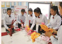
酒店管理实训教学

为学生搭建自我发展的平台，丰富学生的校园生活，实现让学生“有事做、能做事、做正事、长本事”的育人目标，我校组建了56个学生社团，每名学生至少参加一个社团，定期开展丰富多彩的社团活动，让学生在社团活动中增强学习兴趣，重拾自信，励志成才。