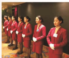
▲ 旅游服务与管理专业学生实习

我校以“面向社会办学，贴近市场育人”为办学宗旨，形成了学校、企业、社会共同依托、共同育人、共同发展的模式，实现了“校企合作高效率、工学结合高标准、顶岗实习高成效、推荐就业高起点、学校发展高效益”的五高目标。大力推行产教融合、工学结合、校企合作、顶岗实习、知行合一的人才培养模式。加强生产性实训建设，逐步扩大生产性实训比例；创新校企一体、工学结合的实践课教学管理和运行制度；完善专业设施的配备，加强校内实训基地建设；强化以育人为目标的实习过程管理和考核评价机制，建立健全实习管理制度；积极探索校企合作“校中厂”、“厂中校”实训基地建设模式与机制；完善“定向式”、“订单式”人才培养模式，推进“五合一”实践教学，将学生培养成企业需要、技术成熟、适销对路的专业人才。已建成校内实验实训室61个，设备价值3000余万元；建成校外实训基地29个，基本满足了实践课教学和学生实习实训的需要。