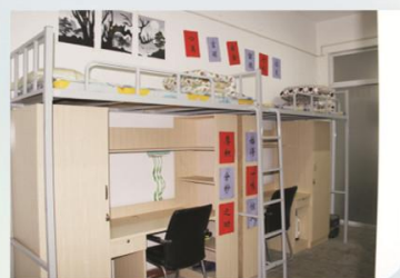
寝室文化布置评比