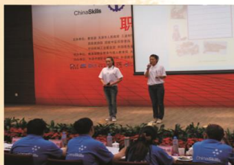
我校学生参加全国中职技能大赛