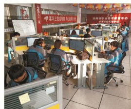
▲ 京东集团电商实训