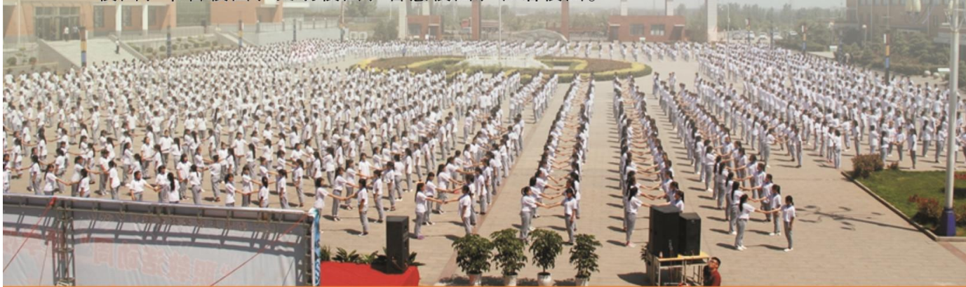
无人机航拍礼仪操

我校始终遵循“发现人的价值，发掘人的潜能，发展人的个性”的培养理念，以人为本，办学规范，管理严格，注重发挥学生的主体作用，通过组建“八大团队”，夯实“十项措施”，以“打造三支队伍，严抓四个细节，丰富活动载体”为抓手，注重对学生的知识、技能、素质进行全面培养。大力开展“十大学习之星”、“文明之星”、“优秀学生”、“优秀学生会干部”、“优秀班干”、“优秀教官”、“优秀团干”、“优秀青年志愿者”等评选活动，常态化进行学习纪律、两课两操、寝室文化布置、班级文化布置、主题活动月、主题班会等评比活动，对班级进行数字化、精细化考核，科学评价班级、班主任、学生，严格落实奖惩制度，营造创先争优的浓厚氛围；强化安全教育、法制教育、身心健康教育、行为习惯养成教育、文明礼仪教育、公民教育……努力创建平安校园、书香校园、文明校园、智慧校园、和谐校园。