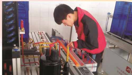
电子电器应用与维修专业