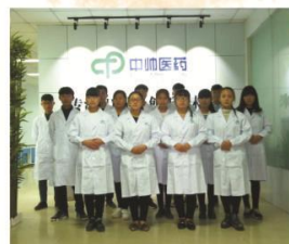
▲ 制药技术应用专业学生实习