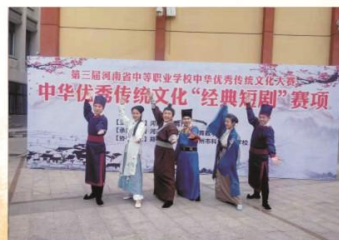
我校学生参加河南省中等职业学校中华优秀传统文化“经典短剧”比赛