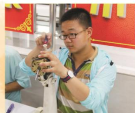
▲ 电子电器应用与维修实验操作