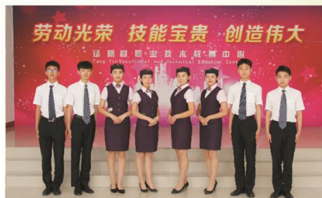
旅游服务与管理专业