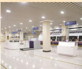
▲ 航空教学模拟实训中心