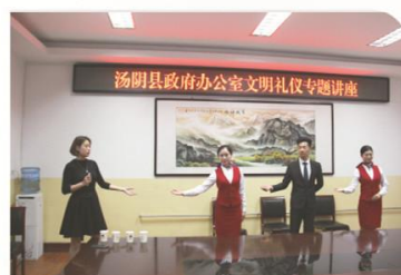
为县政府办公室举办文明礼仪知识专题讲座