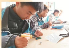
电子电器应用与维修专业实训课教学