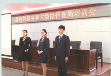
为县政务服务和大数据管理局举办礼仪培训