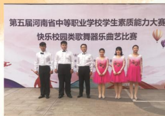
我校学生参加中等职业学校学生素质能力大赛歌舞器乐曲艺比赛