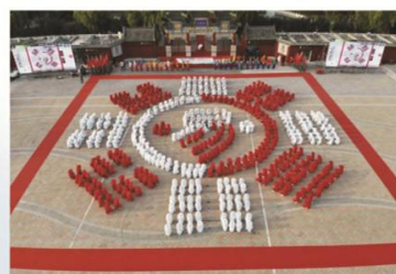
在海峡两岸周易文化论坛开幕式中演出“八卦阵图”