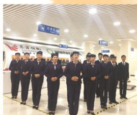
▲ 航空教学模拟实训