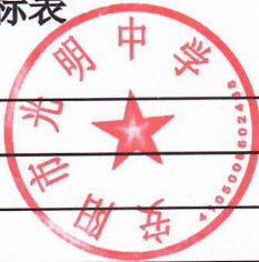
本级部门(单位)整体绩效目标表 (2024年度)