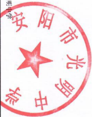
2024年项目支出预算表