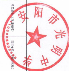
2024年部门预算项目绩效目标表