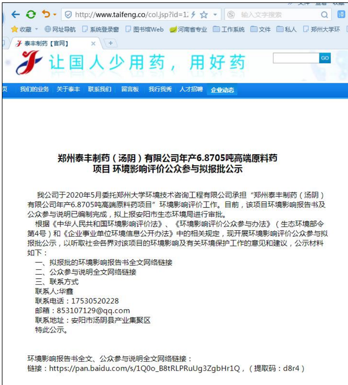
图 4 报批前网上公示截图